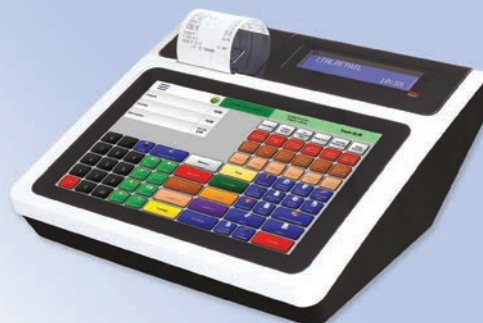
Sistema compatto all in one