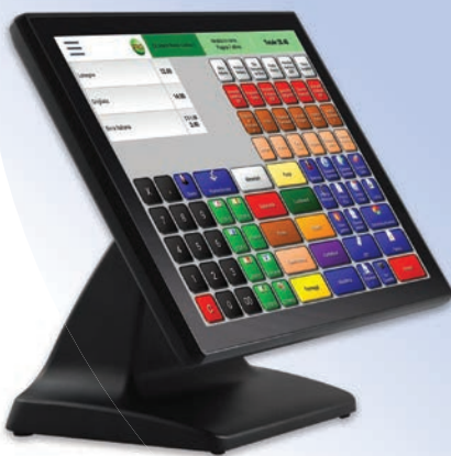
Sistema completo all in one