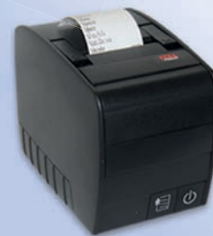
Stampante non fiscale