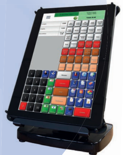
Sistema versatile da 13"